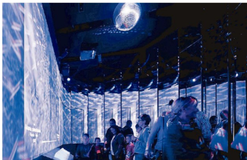
Una sala del museo interattivo del Novecento: presentato il Festival delle Idee